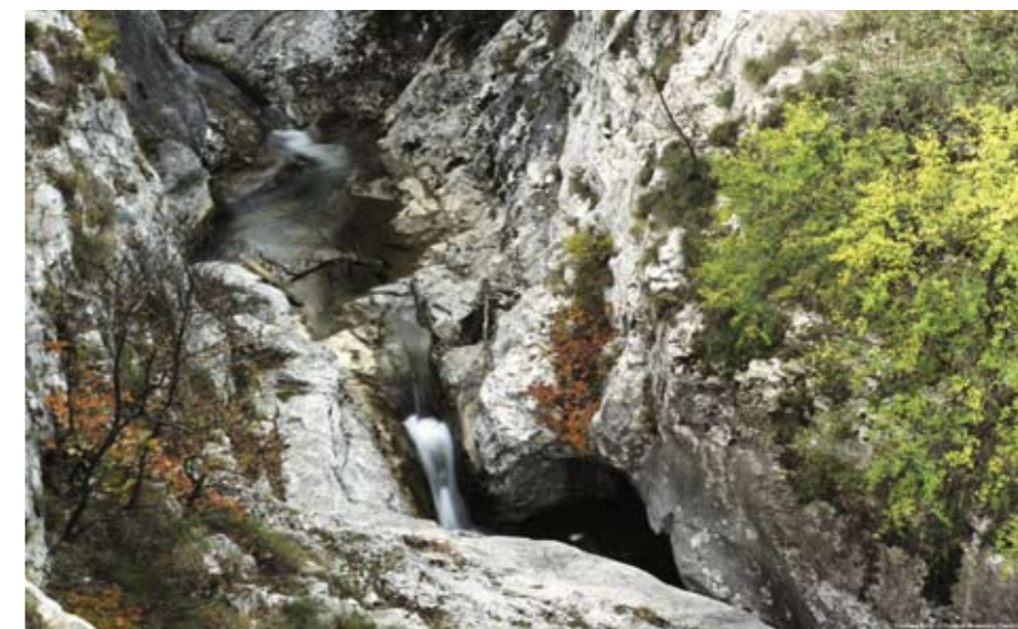
Cascatella del Torrente Rosandra.

Ghiaione del Monte Carso verso la Val Rosandra.