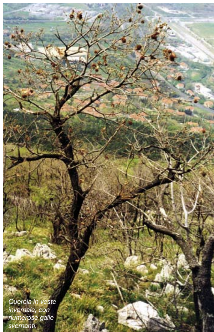
Quercia in veste invernale, con numerose galle svernanti.

Riprendendo un precedente articolo informativo apparso sul Notiziario del Parco (I cinipidi e le galle, luglio 2005), qui si desidera approfondire il concetto di "galla" o "cecidio" e analizzarne brevemente e con la massima semplicità la sua evoluzione.