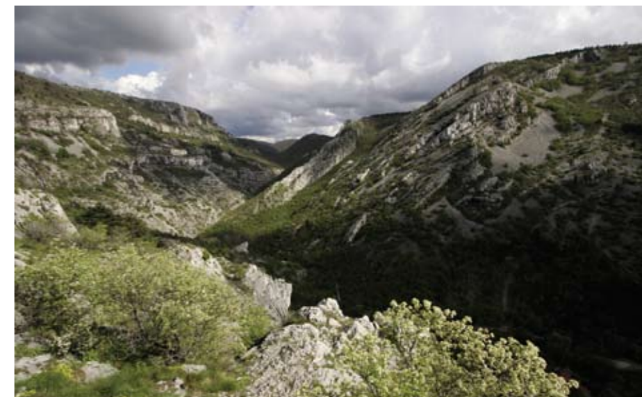
Val Rosandra dalla vedetta di Moccò.

www.riservavalrosandra-glinscica.it info@riservavalrosandra-glinscica.it riserva.valrosandra-glinscica@com-san-dorligo-della-valle.regione.fvg.it