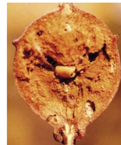
A sinistra: la galla di Andricus quercustozae (Bosc, 1792) sezionata, con la piccola galla interna che ospita l'Imenottero Cinipide.