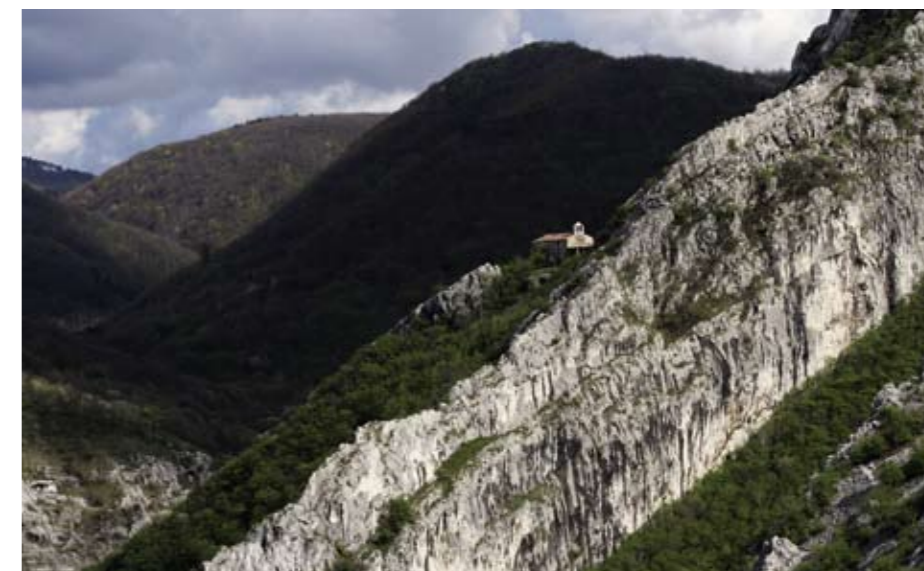
Chiesetta di Santa Maria in Siariis.