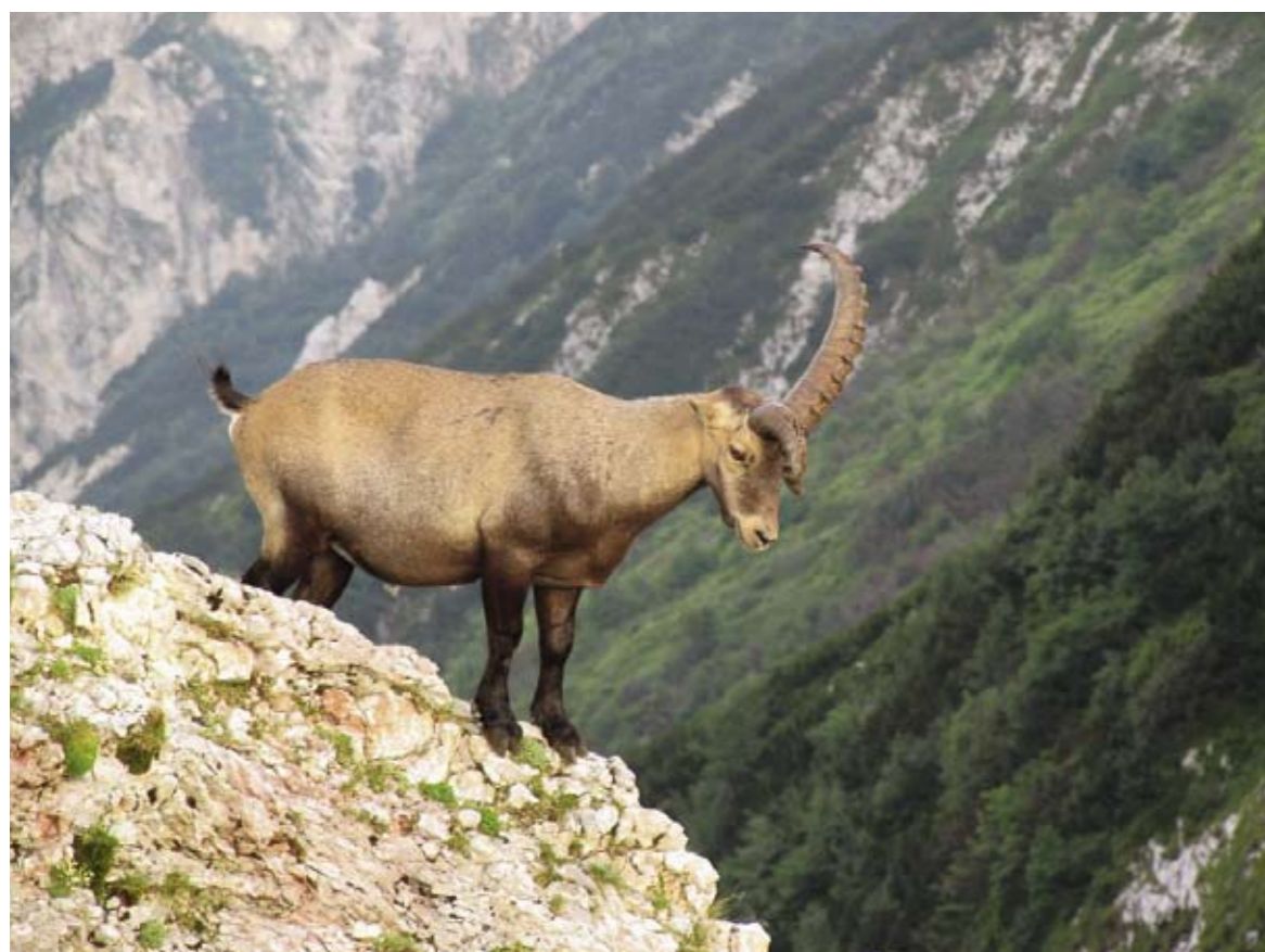
Riconoscibilità naturale. (Foto: Fulvio Genero)

Stambecchi dietro la cima del Monte Plauris. (Foto: Fulvio Genero)