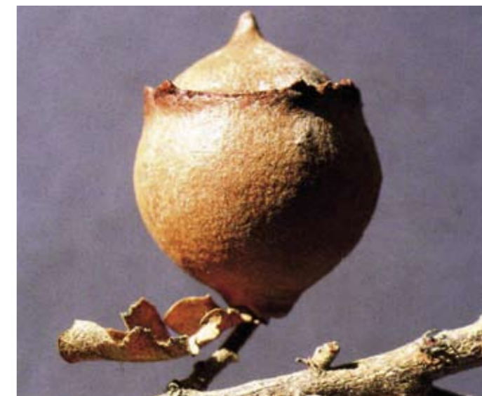
In alto: Andricus quercustozae (Bosc, 1792)

(*) Ricercatore, Museo Civico di Storia Naturale di Trieste.